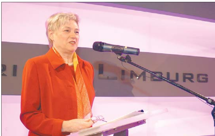
Eveneens present tijdens de TEFAF Business Meeting: de minister van Economische Zaken, Maria van der Hoeven.