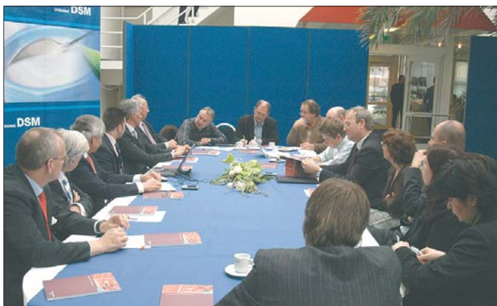
Met het Jaarverslag op tafel wordt de pers geïnformeerd over wat er tussen oktober 2005 en nu – mede door de Versnellingsagenda – in Limburg is gerealiseerd.