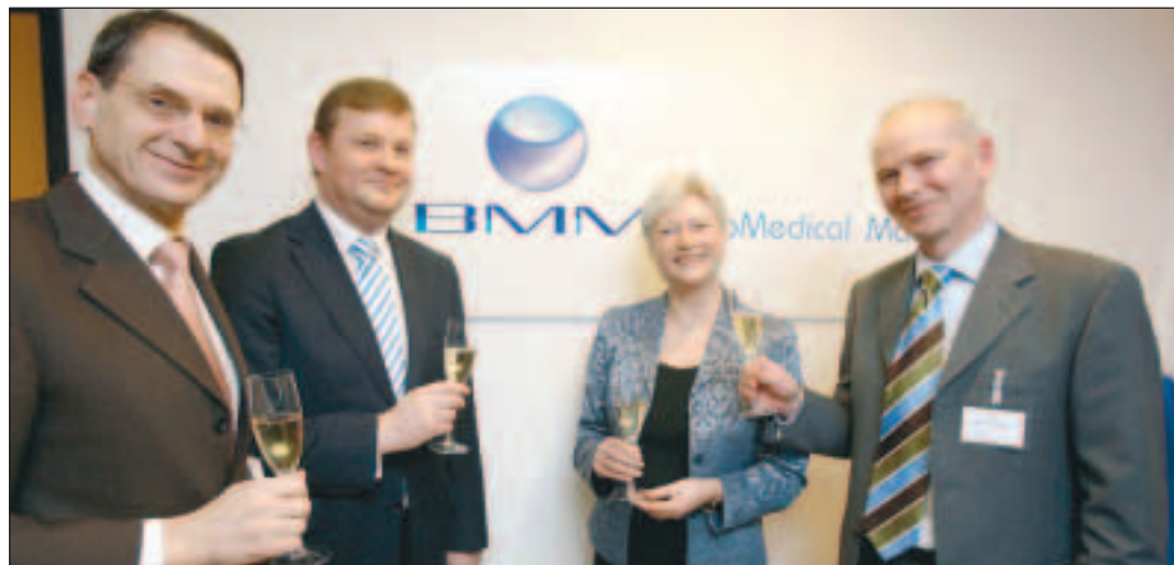
Maria van der Hoeven, minister van Economische Zaken, opende het nieuwe kantoor van het BioMedical Materials Topinstituut (BMM) op Chemelot in Sittard-Geleen in aanwezigheid van de partners van het BMM programma.

Jo Ritzen, voorzitter van de Stichting BMM en voorzitter van het College van Bestuur van de Universiteit Maastricht: "De samenwerking met onze universiteit en andere medische centra maakt het mogelijk dat het onderzoek van BMM in het hart van de geneeskundige wereld kan worden uitgevoerd en snel in de praktijk kan wor-